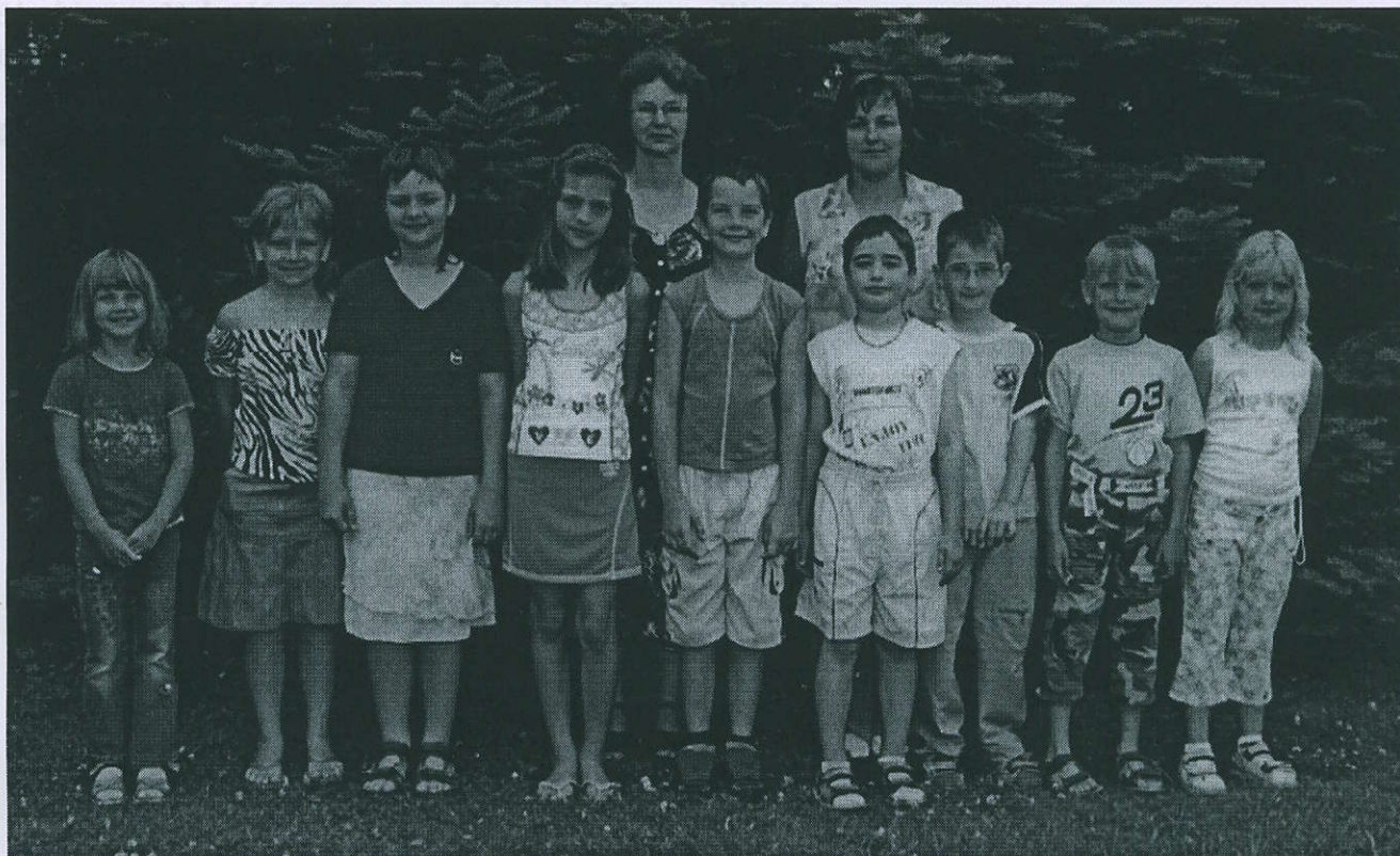
Školní rok 2006 - 2007