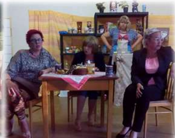
Divadelní premiéra autorské hry Pět odstínů Pepy