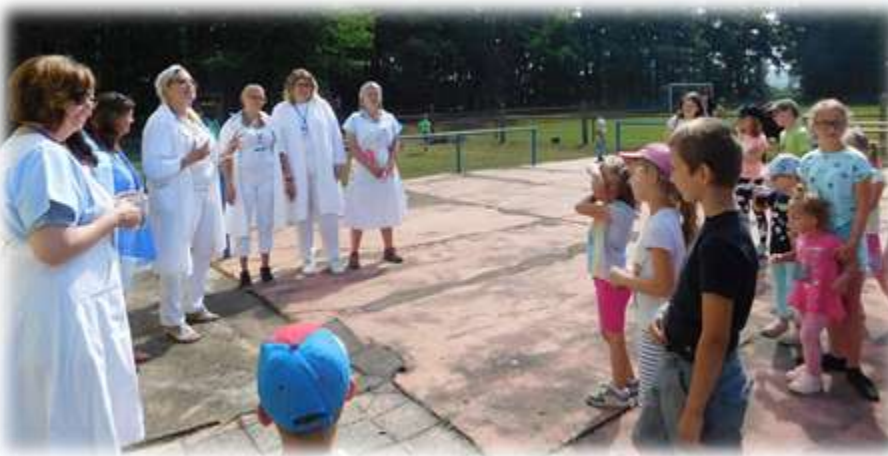
Dětský den Nemocnice na kraji Žďáru