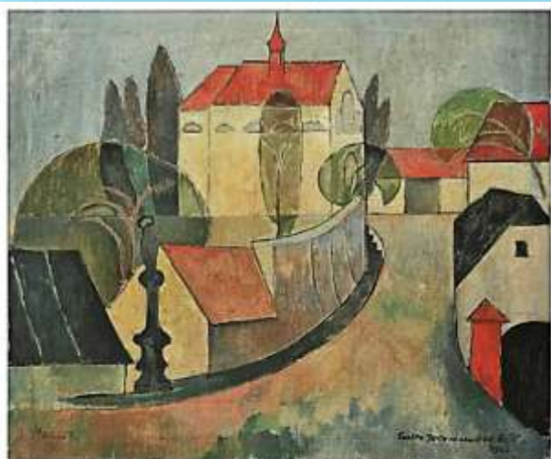
Václav Macháček, „Nedělní ráno“, olej, plátno /54 x 60 cm/ 1963

Krásná rána - a celý rok 2018 plný zdraví, úspěchů, optimismu, pohody, radosti i lásky přeje Vám i Vaším blízkým