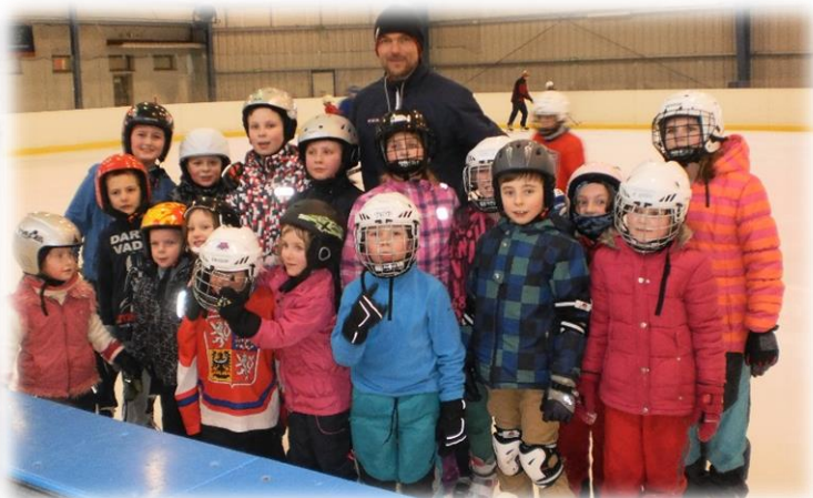
Bruslení v Třebechovicích