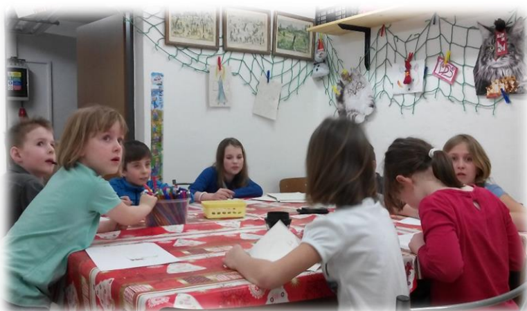
Rukodělný kroužek Šikulka