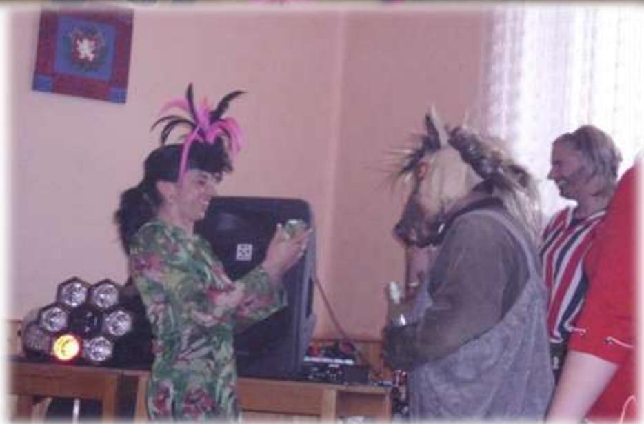
a jeho vítězové v kategorii dospělých masek.