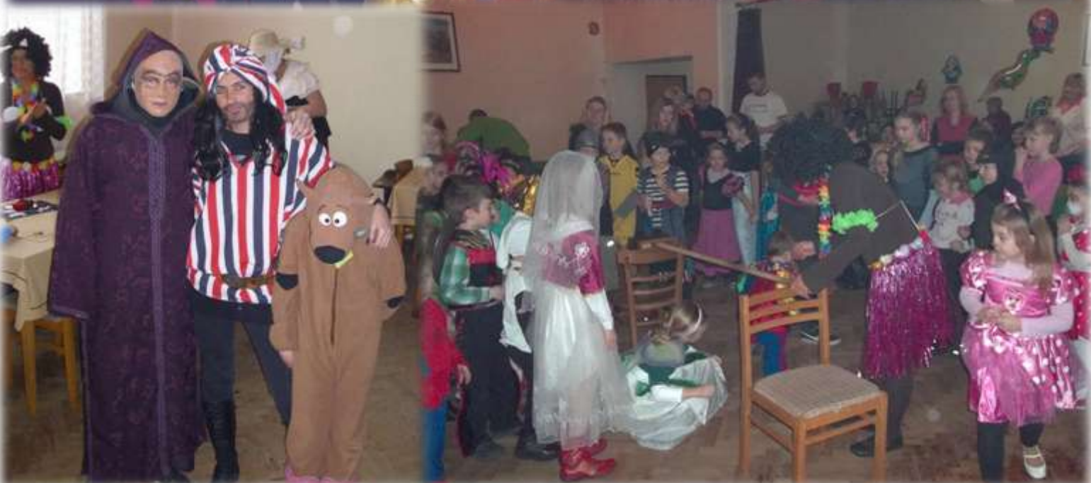
Dětský karneval SDH