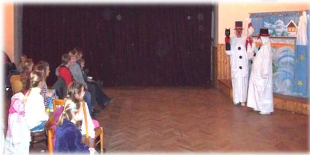
Předvánoční odpoledne s divadelní pohádkou a Mikulášem a jeho pomocníky