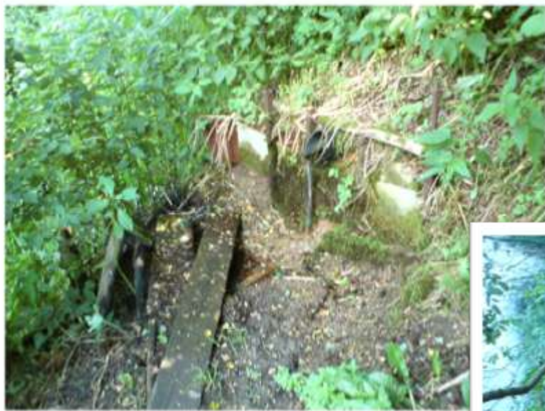
Stav před „rekonstrukcí“