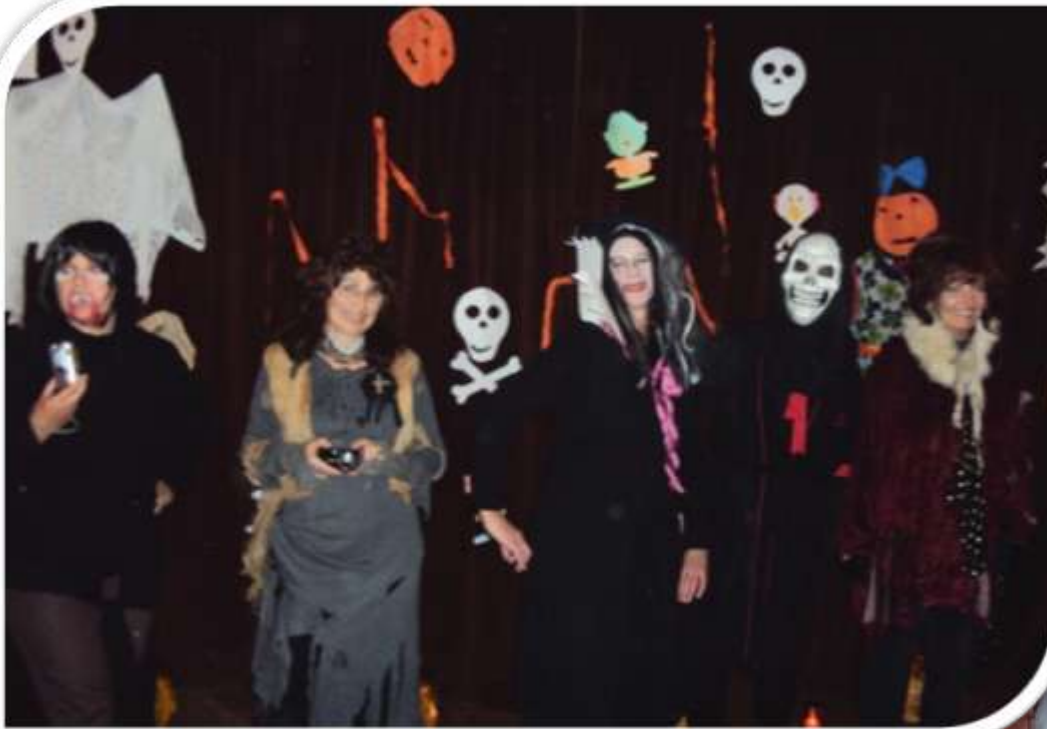
Dospělá halloweenská strašidla