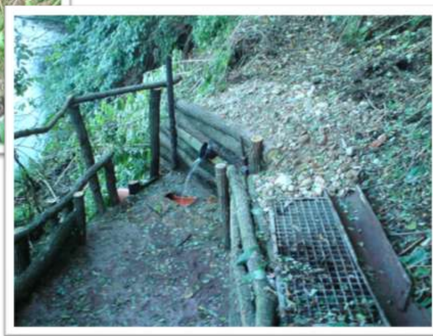
Stav po „rekonstrukci“