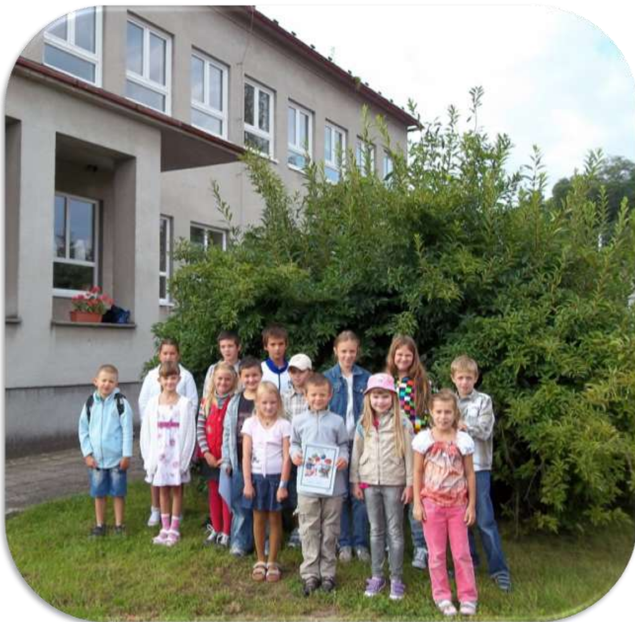
1. září 2011 – žáci Základní školy ve Žďáru nad Orlicí