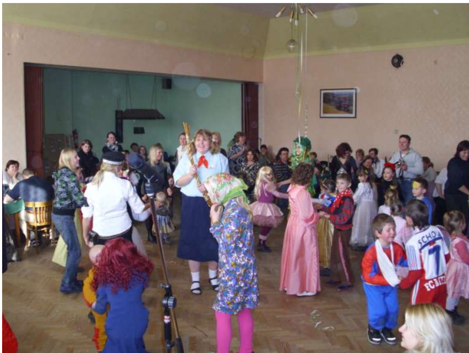
Dětský karneval 2011