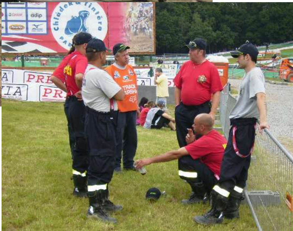
Členové SDH Žďár nad Orlicí – MS v motokrosu 2010