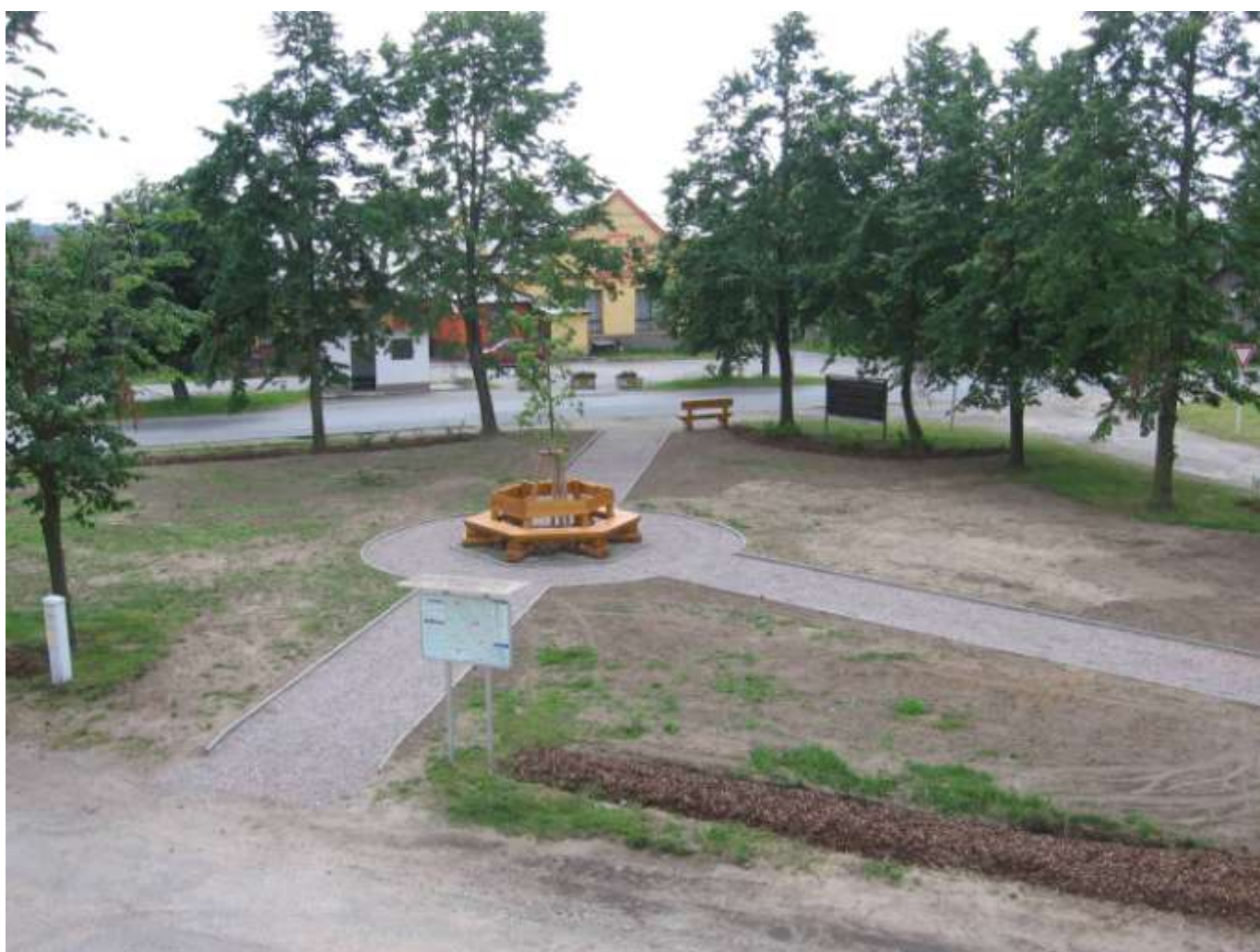
Obecní parčík po úpravách a výsadbě