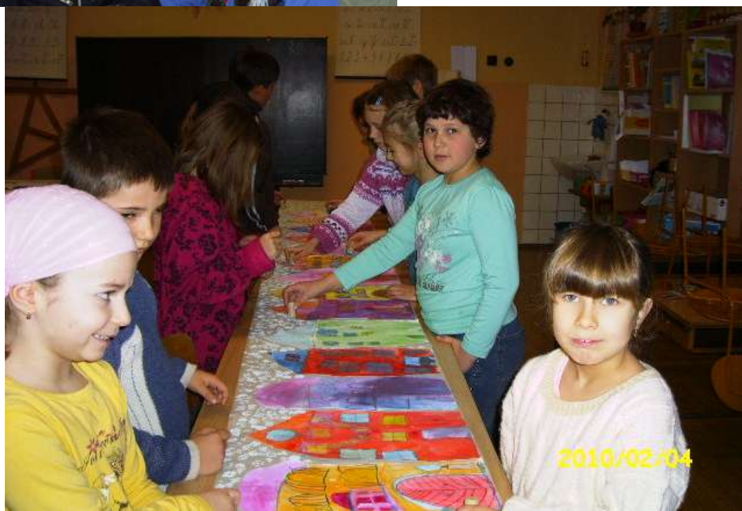
počiny dětí ze ZŠ pro výtvarnou soutěž