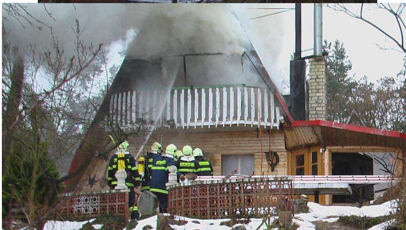
Požár v osadě Světlá