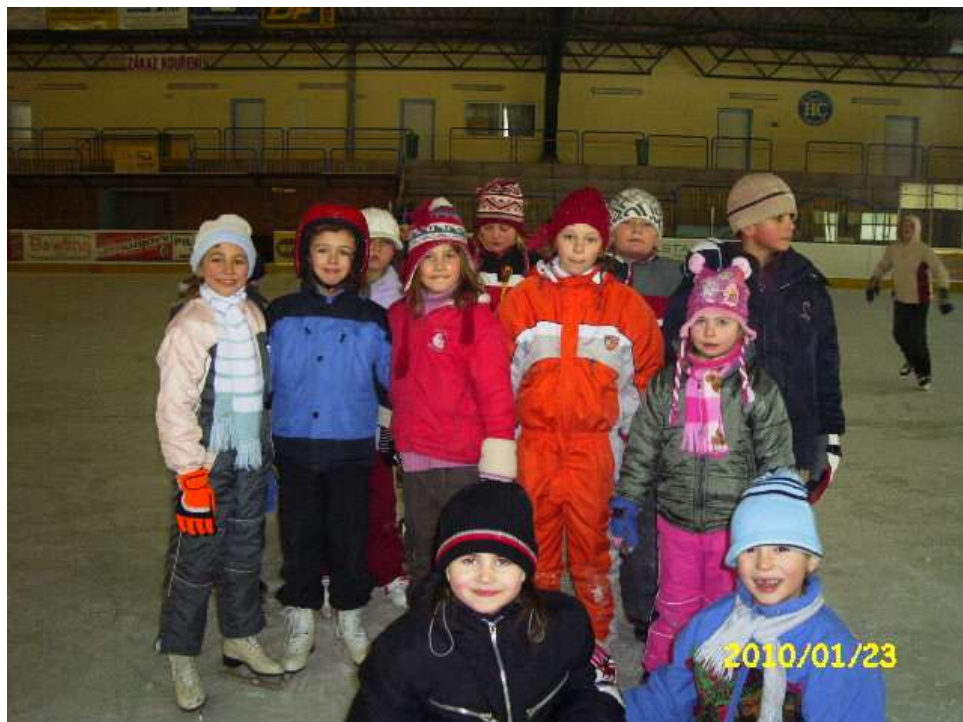
bruslení v Chocni